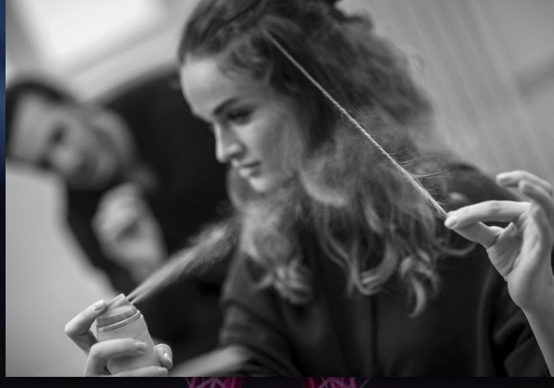
[Beratung im Salon]